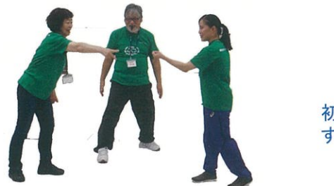
単純なジャンケンも、ゲームに取り入れ方 で大変盛り上がります。