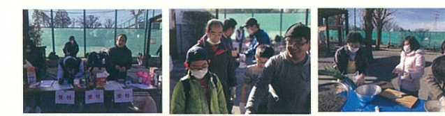
子供から大人まで、楽しい時間を共有しました。