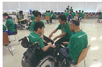
初めての参加でもグループに分かれて活動 するとチームワークの絆ができます。