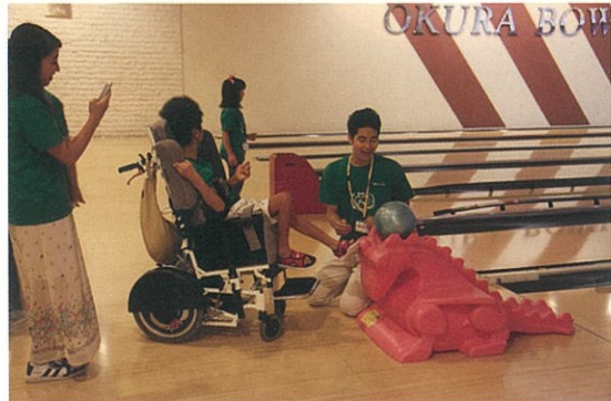
ボウリングも工夫次第でみんなと一緒に楽しめます。