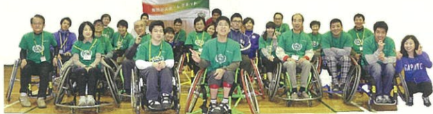
「車イスに乗って鬼ごっこ」都立園芸高校の体育館をお借りしました。