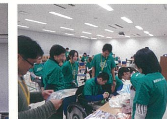
各チームが競い合い、順位毎に好きな賞品を選びました。

(主催：世田谷区スポーツ推進担当部スポーツ推進課) ボランティアスタッフとして参加いたしました。