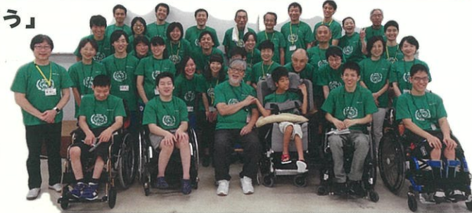
笑顔が笑顔を生み「みんなが笑顔になります」