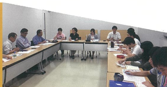
みんなでスポ・レク活動の計画をします。